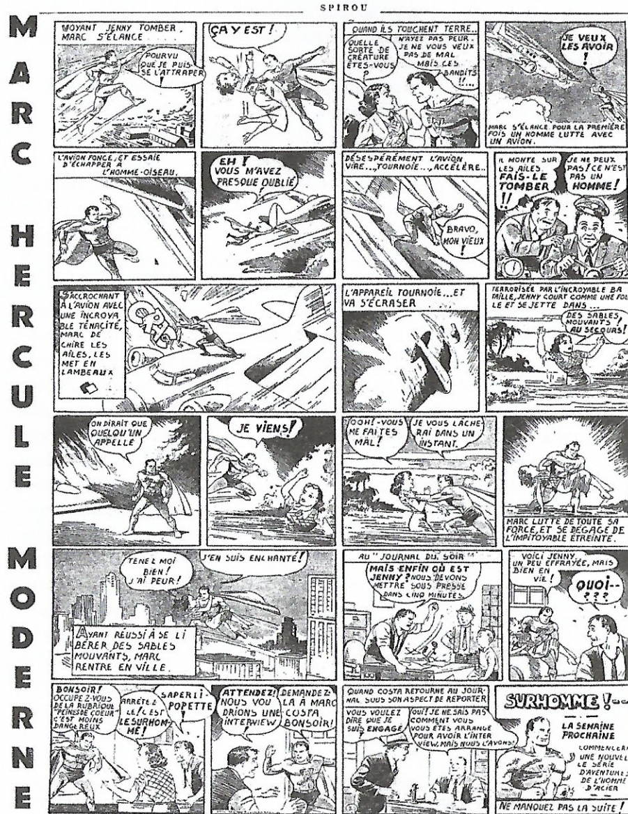
Fig. 1. Le Journal de Spirou, n° 13, 30 mars 1939

[© Éditions Dupuis. Adaptation de Superman the Dailies, « War against Crime » (13-18 février 1939), scénario de Jerry Siegel, dessins de Joe Shuster. © DC Comics].