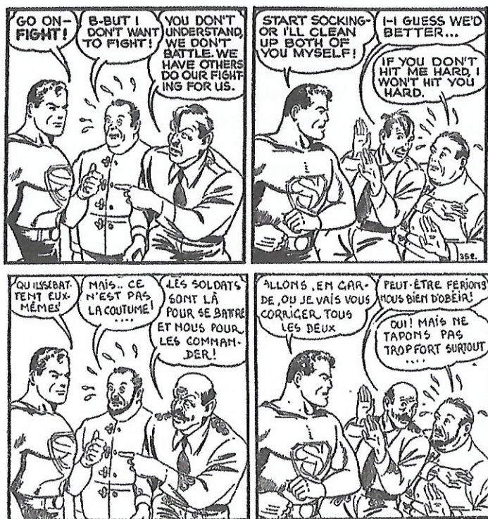
Fig. 3. Aventures, n° 4, 25 janvier 1941 [© Librairie Moderne. Adaptation de Superman the Dailies, « Superman Goes to War » (29 février 1940), scénario de Jerry Siegel, dessins de Joe Shuster. © DC Comics].

Hurrah! qui tire entre 120 000 et 198 000 exemplaires en 1941 39 . Il y reste présent jusqu'à l'arrêt de l'illustré en 1942, ce qui laisse le temps au lecteur de découvrir son pire ennemi, Lex Luthor.