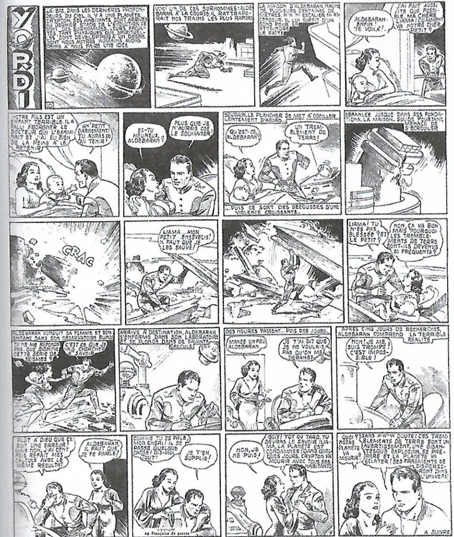
Fig. 2. Aventures, n° 10, 7 mars 1939 [© Librairie Moderne. Adaptation de Superman the Dailies, « Superman Comes to Earth » (16-20 janvier 1939), scénario de Jerry Siegel, dessins de Joe Shuster. © DC Comics].