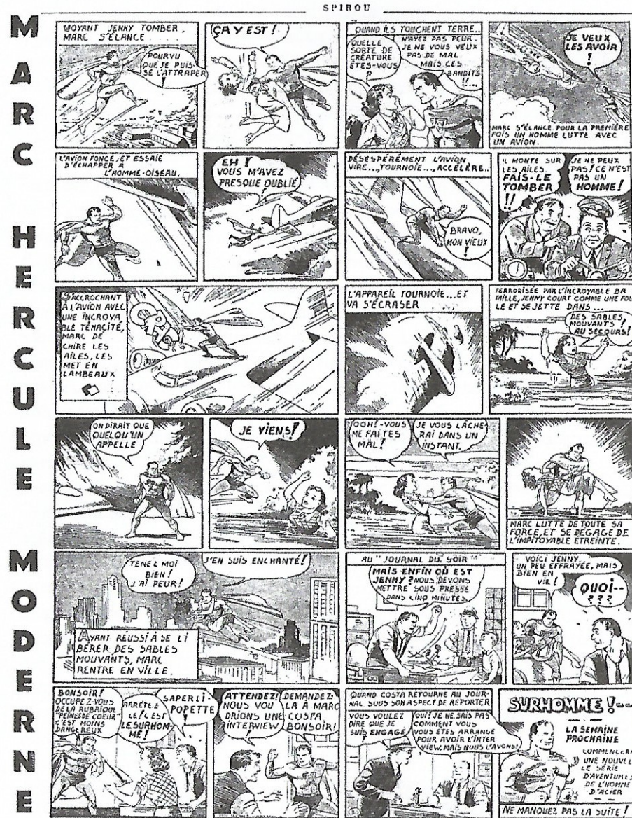
Fig. 1. Le Journal de Spirou, n° 13, 30 mars 1939 [© Éditions Dupuis. Adaptation de Superman the Dailies, « War against Crime » (13-18 février 1939), scénario de Jerry Siegel, dessins de Joe Shuster. © DC Comics].