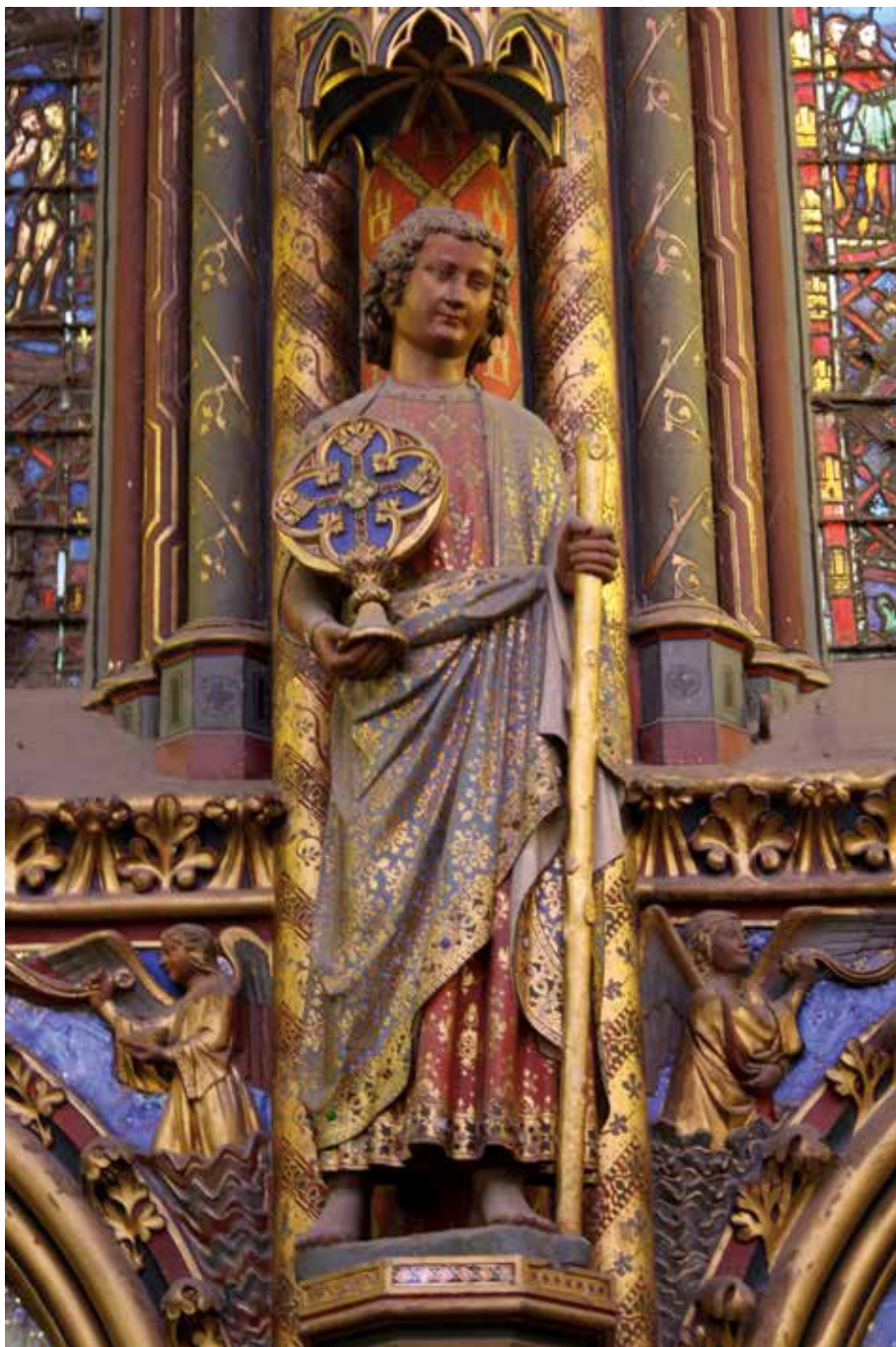
Figure 14 : Apôtre de la Sainte-Chapelle : saint Jean, reconnaissable au fait qu'il n'a pas de barbe.