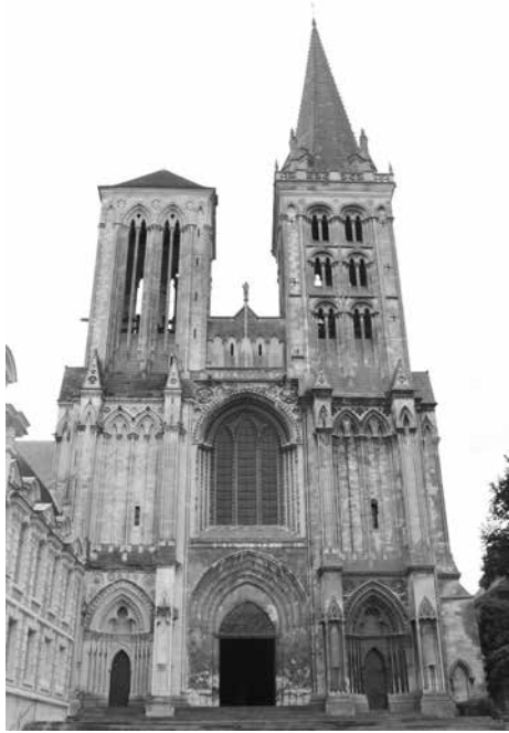
Figure 10 : Lisieux, cathédrale, façade occidentale.