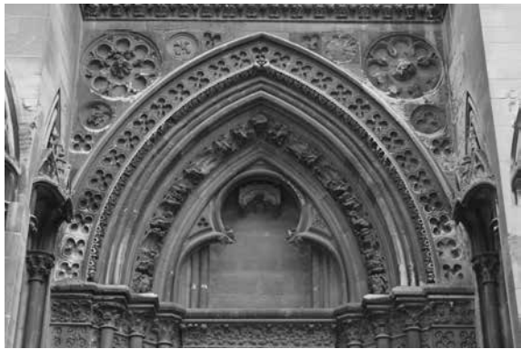
Figure 12 (à droite) : Lisieux, cathédrale, tympan du portail sud de la façade occidentale.