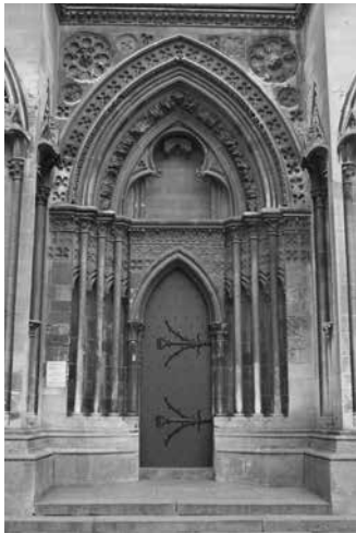
Figure 11 (à gauche) : Lisieux, cathédrale, portail sud de la façade occidentale.