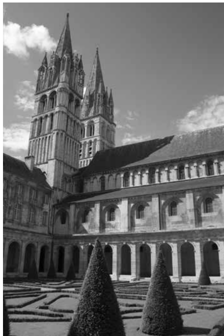
Figure 9 (à droite) : Caen, Saint-Étienne, clochers vus du cloître.