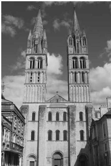
Figure 8 (à gauche) : Caen, Saint-Étienne, façade occidentale.