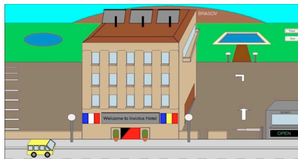
Fig 1. Extrait de l'animation d'un prototype virtuel d'un hôtel intelligent.

Le premier sujet de stage a concerné un étudiant de la licence professionnelle Electronique et Informatique Embarquée appliquée aux Transports [12]. D'une durée de quatre mois, le stage a consisté en la création d'un prototype virtuel d'un hôtel intelligent. Le système offrait la représentation de l'hôtel et des systèmes automatiques attachés. La mise en œuvre d'une barrière de sécurité, le remplissage d'une piscine, la gestion des panneaux solaires selon la course du soleil en sont quelques éléments. De plus, le programme proposait en complément de la course du soleil, la commande des portes, volets, lampadaires selon la période de la journée. Un extrait de l'animation prototype virtuel d'hôtel intelligent est donné en figure 1. Le minibus jaune sur le schéma fait également partie de l'animation.