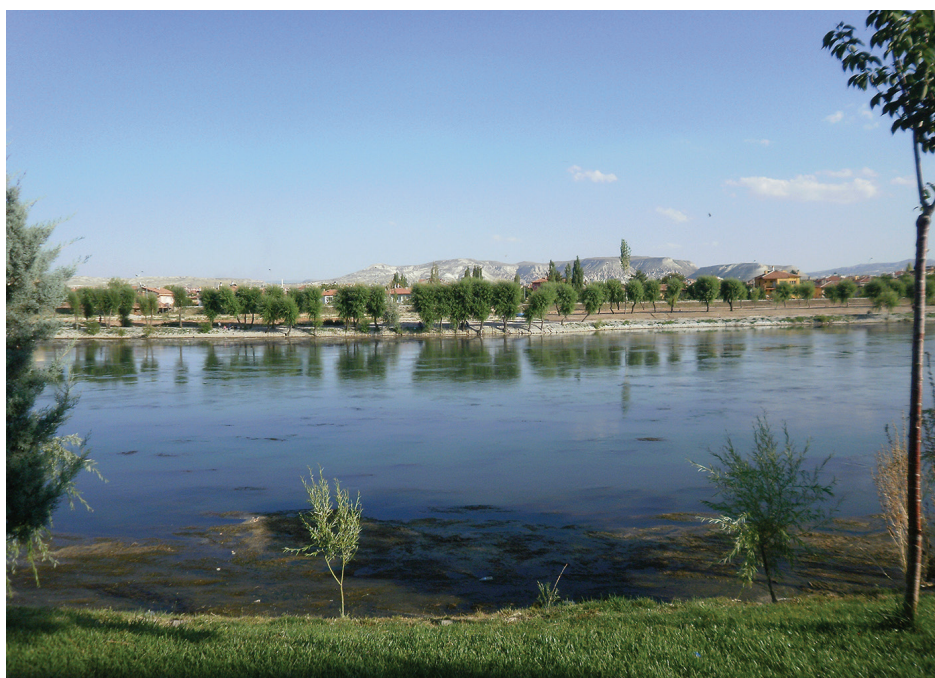
Fig. 2. L'Halys à Avanos, juillet 210.