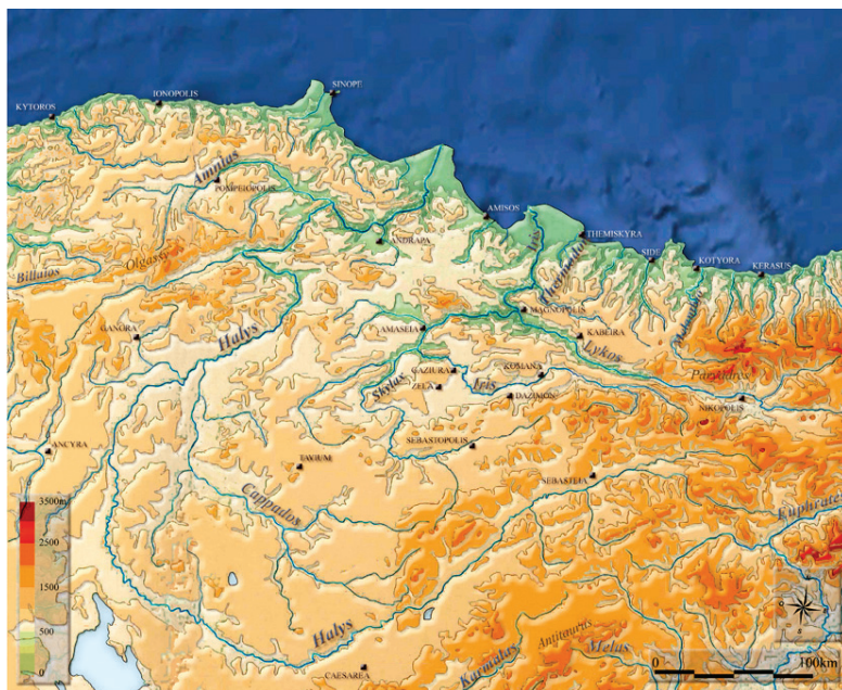
Fig. 3. Bassin de l'Halys.