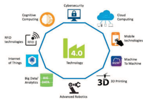
Figure 1. Les piliers de l'Industrie 4.0 [Saturno et al., 2017]

L'aspect restrictif de l'Industrie 4.0 concerne les dimensions environnementales et sociétales dans la limitation des ressources utilisées et des impacts sociétaux des technologies utilisées. Quant à la complexité, elle est induite par :