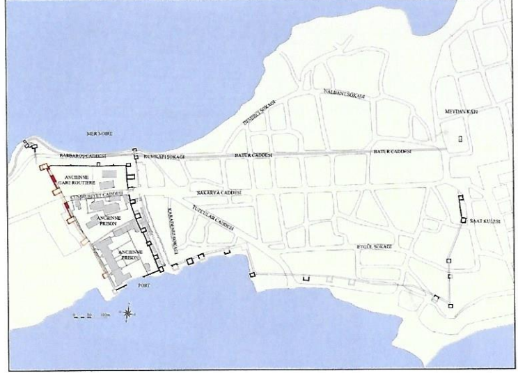
Roma Fethinden önce Sinop Surlarının Haritası Map of Sinop fortifications before the Roman conquest

M.Ö. 45 yılında koloni olmak bir cezalandırma yöntemiymiş ama çok geçmeden bu durumu Roma İmparatorluğu Döneminde Sinope'nin gelişmesinde ve refahında bir avantaj oldu.