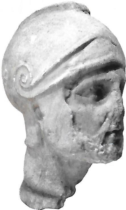
Roman Asker Başı Head of a Roman soldier