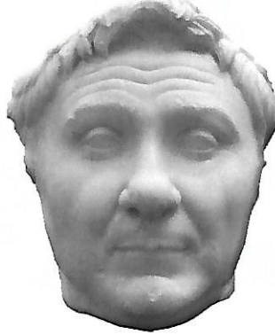
Büyük Pompeius Başı Head of Pompey the Great