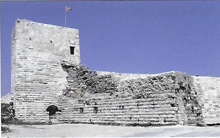
Sinope Helenistik Sur Kalıntıları Remains of the Hellenistic fortifications of Sinope