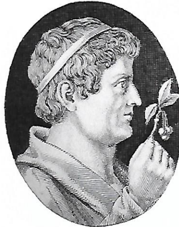
Lucullus Portresi Portrait of Lucullus