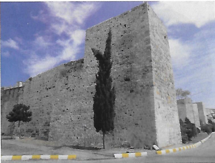
Akropol Surlarının Güney-Batı Köşesi Southwestest corner of the acropolis fortifications

The Greek city of Sinope was taken in 70 BC by Roman General Lucius Licinius Lucullus during the Second Mithridatic War. After the suicide of Mithridates VI Eupator in Crimea in 63 BC, Pompey the Great allowed Mithridates' burial in Sinop, his birthplace and burial place of the Kings of Pontus .