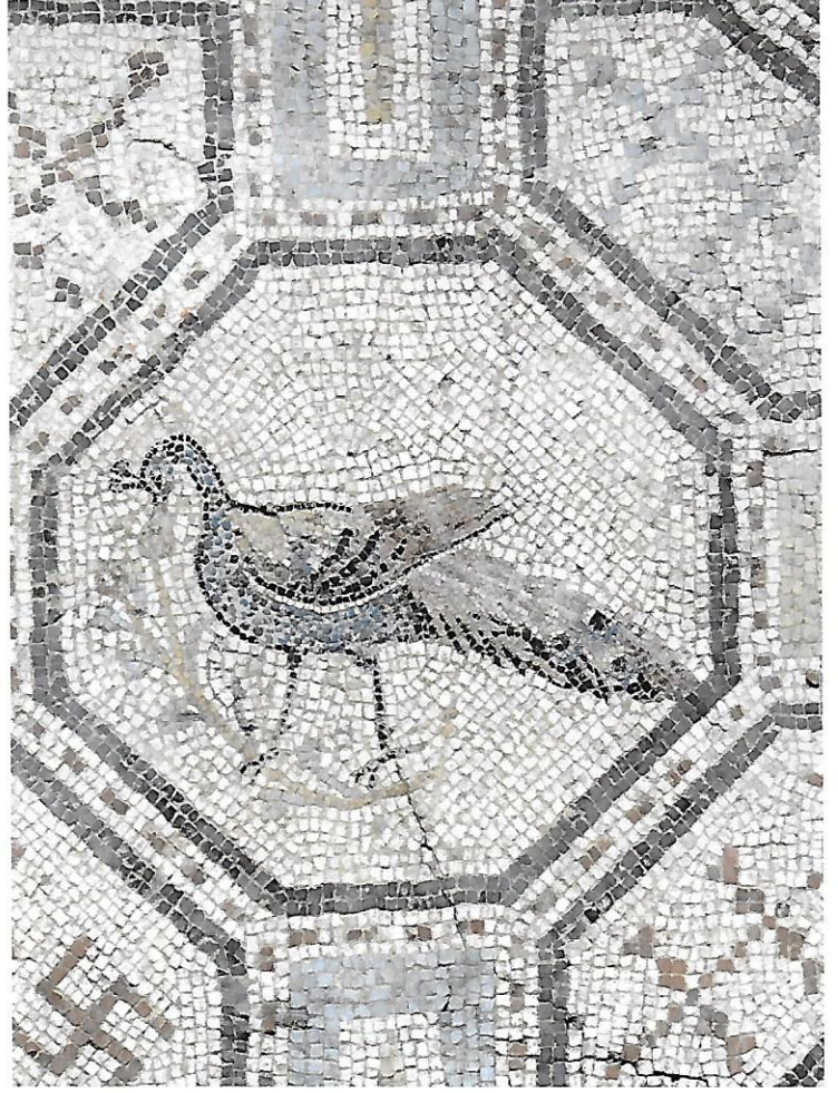
Meydankapı Mozaiği, Tavuskuşu detayı Meydankapı Mosaic with peacock detail

Sinope was besieged by Roman General Lucullus in 70 BC during the Second Mithridatic War. The Hellenistic walls were partly destroyed and the public monuments damaged. In the 2 nd century AD, a Roman aqueduct was constructed to supply water to the city. A new Roman district was constructed outside the western walls of the city, and the Roman Baths (Balatlar) offered a very comfortable Roman way of life to the citizens of the Colonia Iulia Felix Sinope .