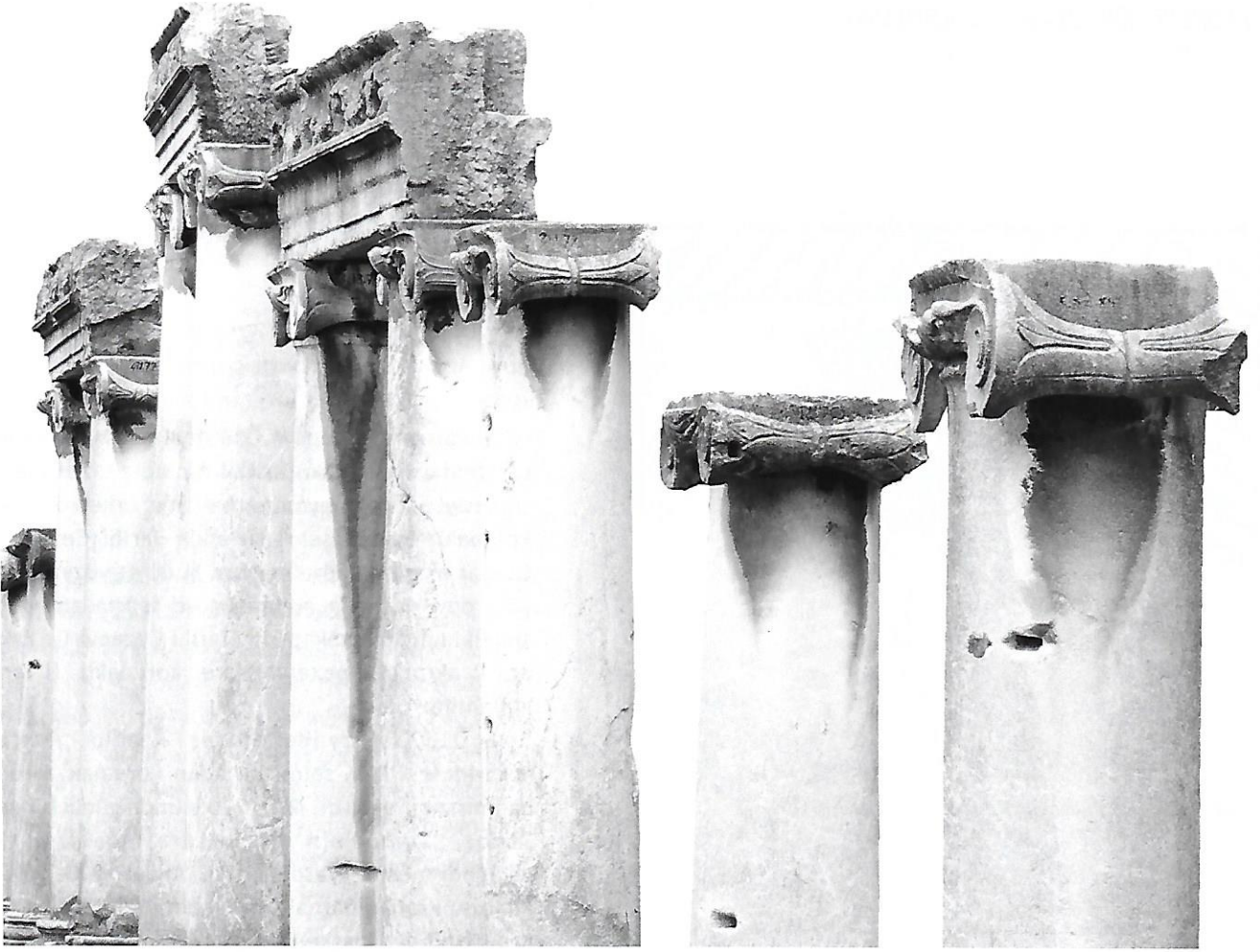
Roma Dönemi Sütunları Roman columns