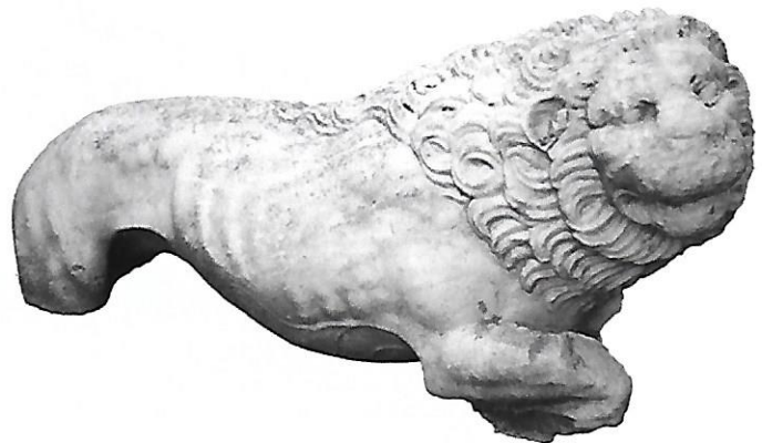
mermer Aslan Marble lion

külütür mirası, patrimoniu cultural, πολιτιστική κληρονομιά, культурно наследство, культурна спадщина, კულტურული მემკვიდრეობა, patrimoniu cultural, cultural heritage