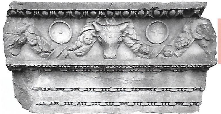
Boğalı ve Çelenkli Arşitrav Architrave ornamented with bulls and garlands

Titus Veturius Campester, İmparatorluk Kültü Rahibi'ne (M.S. 143-161) İthafı Dedication to Titus Veturius Campester, priest of Imperial Cult (143-161 AD)