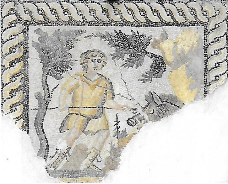
Yaban Domuzu Avı Sahnesi, Meydankapı Mozaïği Wild boar hunting scene, Meydankapı mosaic

Yunan şehri Sinope M.Ö. 631 yılında Miletli kolonistleri tarafından insanların kıstak bir bölge üzerine yerleştirilmesiyle kurulmuştur. Arkaik ve erken Klasik dönem korunaklı Sinope şehri şu anda Tarihi Cezaevi ve Eski Otogar arasında kurulmuştur. M.Ö. 4. yüzyıldan itibaren yeni duvarlar inşa edilmiştir ve şehrin ana giriş kapısı şimdiki adıyla Kumkapı'dır. Tarihi Cezaevi ile Eski Otogar arası akropol, pazaryeri ve korunaklı liman olarak kullanılmıştır.