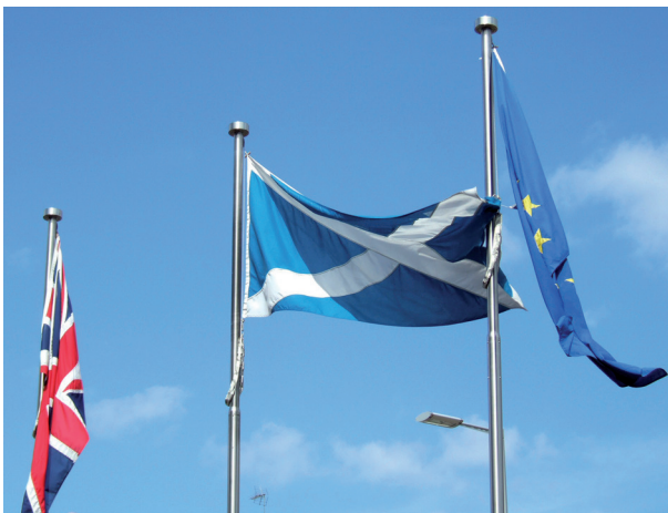
FIGURE 1 – L'Écosse entre deux unions

Au mois de juillet, peu après la désignation de Theresa May comme Première Ministre, Sturgeon énonça ses « lignes rouges », correspondant à cinq « intérêts » de l'Écosse : démocratique (le respect du résultat du référendum), économique (le marché unique incluant la libre circulation des personnes), social (droits et protections des salariés garantis par l'UE), la solidarité (protection mutuelle) et l'influence (participation