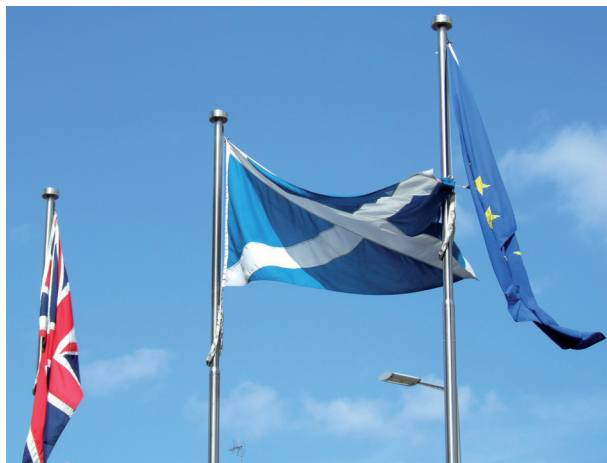
FIGURE 1 – L'Écosse entre deux unions

Au mois de juillet, peu après la désignation de Theresa May comme Première Ministre, Sturgeon énonça ses « lignes rouges », correspondant à cinq « intérêts » de l'Écosse : démocratique (le respect du résultat du référendum), économique (le marché unique incluant la libre circulation des personnes), social (droits et protections des salariés garantis par l'UE), la solidarité (protection mutuelle) et l'influence (participation