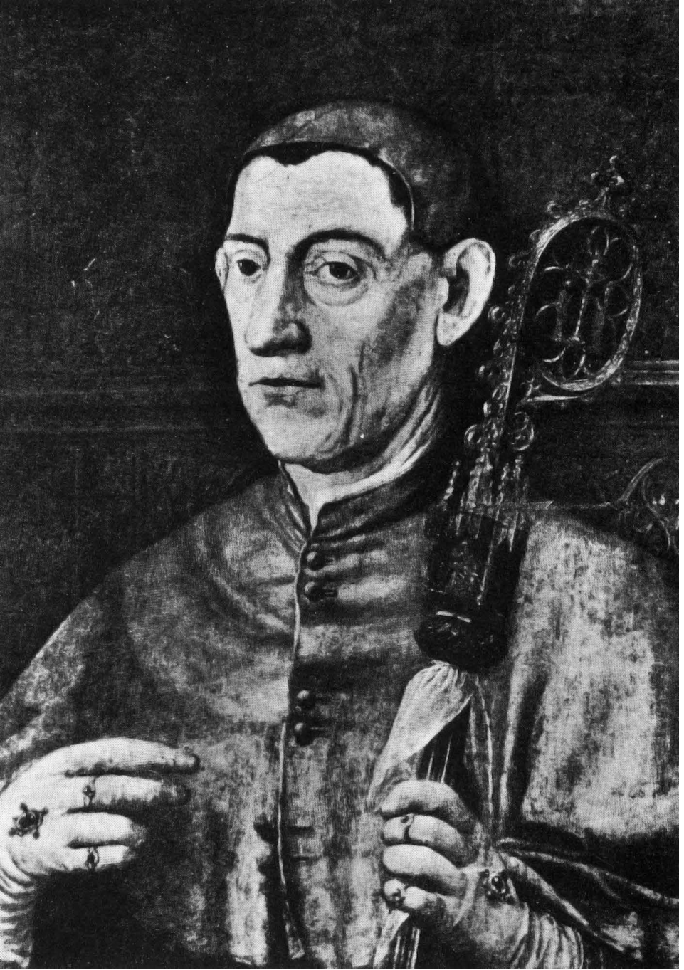
Figure 2: Anonyme, Portrait du soi-disant cardinal Jean de Baviere, XVI e siecle?, Espagne, collection privee non localisee (© d apres Elisa Bermejo Martinez, 1980).