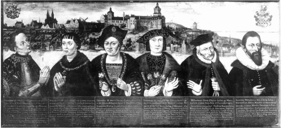
Figure 10: Anonyme, Les six ducs de la Maison de Cleves, vers 1650, huile sur panneau, 62,5 × 138 cm, Cleves, Städtisches Museum Haus Koekkoek (© Cleves, Museum Haus Koekkoek).