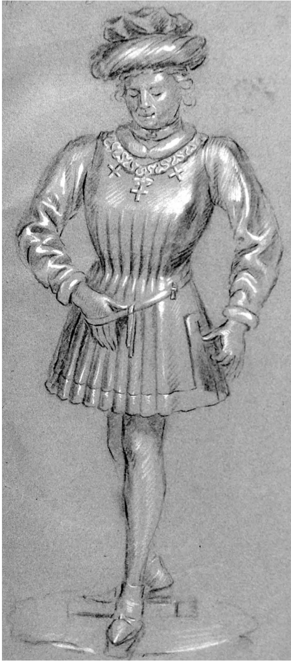
Figure 8: Anonyme, Dessin de la statuette de Jean de Cleves (provenant du soubassement du tombeau de Louis de Male, anciennement à Lille), XVIII e siècle, pierre noire et rehauts de blanc sur papier bleu, Lille, Bibliothèque municipale, Ms. 852, f o 11r.