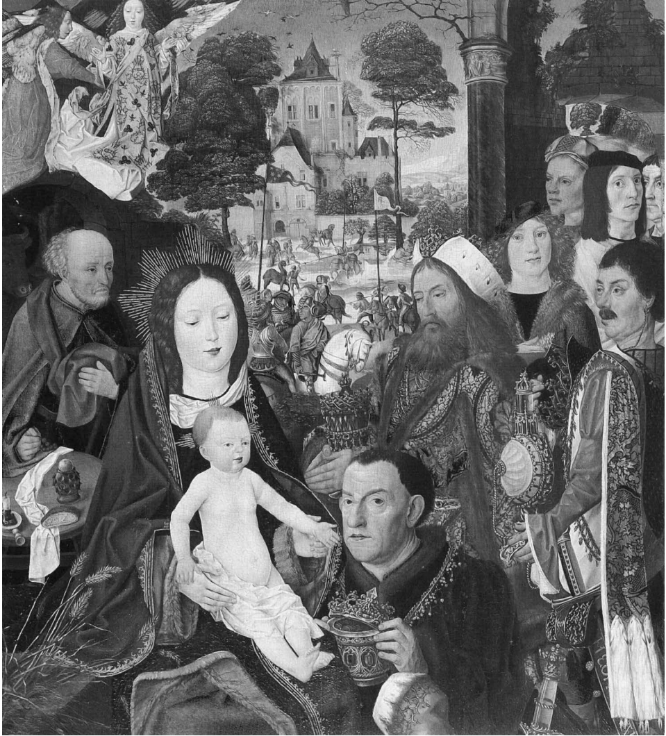
Figure 5: Maître de l'Autel d'Aix-la-Chapelle, Adoration des Mages, vers 1500, huile sur panneau de chêne, 69 × 61 cm, Bonn, Rheinisches Landesmuseum (© Bonn, Rheinisches Landesmuseum).