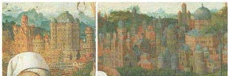
Fig. 4a et b. ENTOURAGE DE JEAN VAN EYCK, Crucifixion, 2 e quart du XV e siècle, BERLIN, Staatliche Museen, Gemäldegalerie, Propriété du Kaiser Friedrich Museumvereins, Inv. 525 G ; JEAN VAN EYCK (ENTOURAGE), Trois Marie au Tombeau, détail, ca 1430-1435, ROTTERDAM, Musée Boijmans Van Beuningen, Inv. 2449

La relation entre ces quelques architectures du panorama urbain du panneau de Rotterdam et la description de Jérusalem dans la Guerre des Juifs suffit-elle à écarter l'hypothèse d'un passage du peintre flamand par Jérusalem ? La réponse à cette question est évidemment négative ; elle l'est d'autant plus qu'au-delà de la seule traduction en image des descriptions données par Flavius Josèphe, la vision