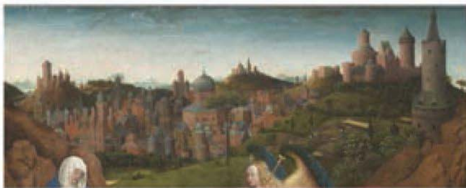
Fig. 1a et b. JEAN VAN EYCK (ENTOURAGE), Trois Marie au Tombeau, tableau entier et détail, ca 1430-1435, ROTTERDAM, Musée Boijmans Van Beuningen, Inv. 2449

Le panneau de Rotterdam a donné lieu à des controverses sans fin quant à son attribution et sa datation 42 . Apparu à Bruges au début du XIX e siècle, son origine