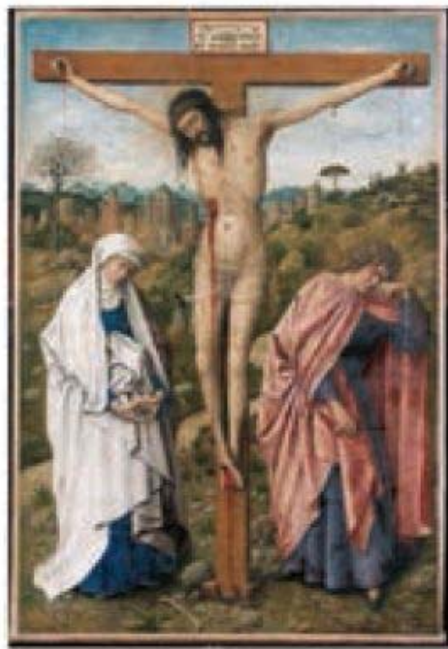
Fig. 3. ENTOURAGE DE JEAN VAN EYCK , Crucifixion, 2 e quart du XV e siècle, BERLIN, Staatliche Museen, Gemäldegalerie, Propriété du Kaiser Friedrich Museumvereins, Inv. 525 G.