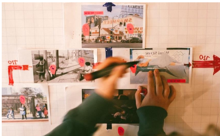
Figure 1. Exemple de parcours utilisateur (user flow).

La programme d'IF Lab se décompose de deux stages, Story Booster et Prototype Booster, d'une durée de cinq jours chacun. Le premier workshop propose aux auteurs de revisiter leurs intentions à travers le prisme des besoins et attentes supposés de leur utilisateur cible. Dès le premier jour, les participants sont invités à identifier collectivement la nature du public auquel il s'adresse afin de découvrir les problèmes et incohérences de leur concept interactif. Dans un deuxième temps, la réflexion s'oriente sur les avantages et inconvénients des différents dispositifs sociotechniques à leur disposition (ordinateur, tablette, téléphone, casque de VR, installation, etc.). En fonction des spécificités de leur audience, du contexte d'usage et du type d'impact que l'auteur souhaite produire, le reste de la semaine est consacré à explorer un large spectre de scénarisations interactives. Deux journées sont ensuite focalisées sur la fabrication d'un prototype papier 53 . Celui-ci vise à matérialiser, simuler et évaluer la navigation imaginée par l'auteur.