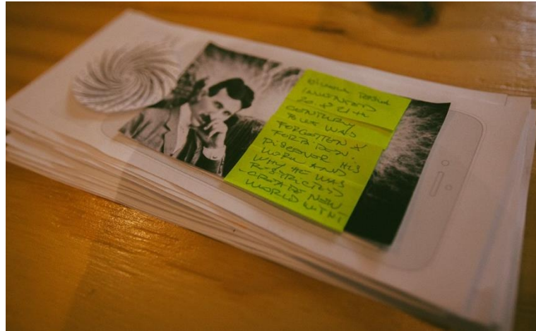
Figure 2. Exemple de prototype papier.