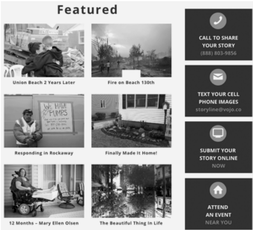
5 Screenshot aus Sandy Storyline , partizipatorischer Modus

[wiedergeboren]» (ebd., S. 66–68). Allgemeiner gesprochen verweist die Perspektive der Emergenz einer dokumentarischen Poësis auf den Begriff des empowerments der UserInnen, wie sie vor allem im Bereich des Produkt- und Servicedesigns entwickelt wurde. 22