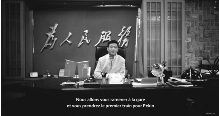
1 Screenshot aus Voyage au bout du Charbon , Büro des Direktors: «Wir bringen Sie zum Bahnhof und Sie werden den nächsten Zug nach Peking nehmen.»

Lev Manovich zufolge ist es – im Unterschied zum filmischen Text – möglich, die unterschiedlichen Einheiten einer hypermedialen Dokumentation aufgrund ihrer Informationsarchitektur zu unterscheiden: «Jede Struktur hypertextueller Links kann dementsprechend unabhängig vom medialen Inhalt des Dokuments präzisiert werden.» 15 Die Wahl der hypermedialen Architektur bestimmt demzufolge ein Navigationsprinzip, das eng mit der Narration verbunden ist. Wie auch immer die Komplexität der Informationsstruktur (linear, baumförmig, parallel, netzartig, hybrid, etc.), die Herausforderung für die Enunziationsinstanz besteht letztlich darin, in einer geschlossenen Architektur eine Vielzahl möglicher Lektürewege zu entwickeln. Voyage au Bout du Charbon (2008) ist das gelungene Beispiel einer Webdokumentation, die vielfache Wahlmöglichkeiten auf der Basis eines bekannten literarischen Motivs anbietet. Die UserInnen werden dazu eingeladen, sich mit der imaginären Figur des berühmten unabhängigen Reporters zu identifizieren, der eine gefährliche journalistische Untersuchung über die Arbeitsbedingungen in chinesischen Kohleminen durchführt. 16 Im Kontext einer dramaturgischen Engführung kehrt der Journalist im Laufe seiner Ermittlungen zum Büro des Minendirektors zurück und wird dort dazu gezwungen, auf sein ursprüngliches Vorhaben zu verzichten und unverzüglich nach Peking zurückzufahren (vgl. Abb. 1).