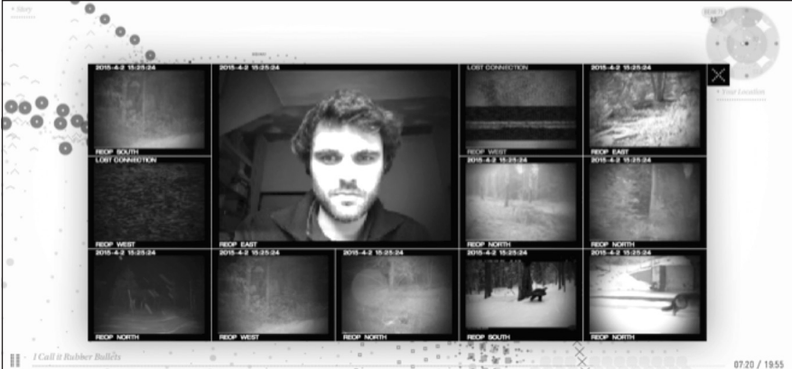
3 Screenshot aus Bear 71 , Webcam eines Users, integriert in das filmische Interface

Aufnahmen werden dabei in ein Interface integriert, das eine Reihe verschiedener Überwachungsbilder zeigt (Abb. 3). Auf diese Weise spiegeln sich die UserInnen im medialen Dispositiv wider, in das sie während der Zeit der Navigation integriert sind. Sie geraten so zu BeobachterInnen ihrer eigenen Präsenz im Inneren einer Tierwelt, die die wilde Umgebung bevölkert.