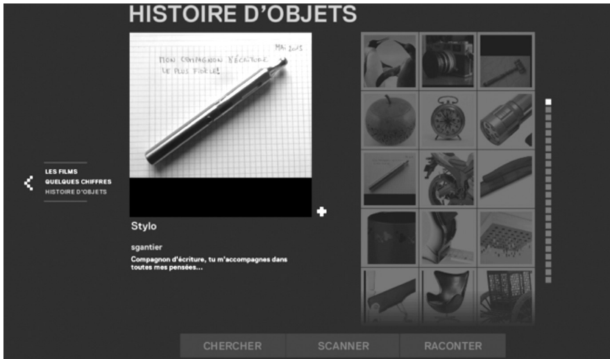
4 Screenshot aus Code Barré, kontributorischer Raum

ebenso partizipieren, indem sie die Fotografie eines Objektes mit einer Legende versehen und diese posten, um auf diese Weise an der Erstellung einer online verfügbaren Bibliothek von Objekten teilzuhaben (Abb. 4).