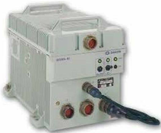
A. La centrale inertielle de la mission Apollo en 1961 (24kg, 263cm 3 )