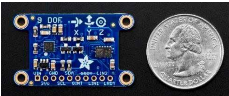
B. Une centrale inertielle du commerce (Adafruit, 3g, 21mm 3 )