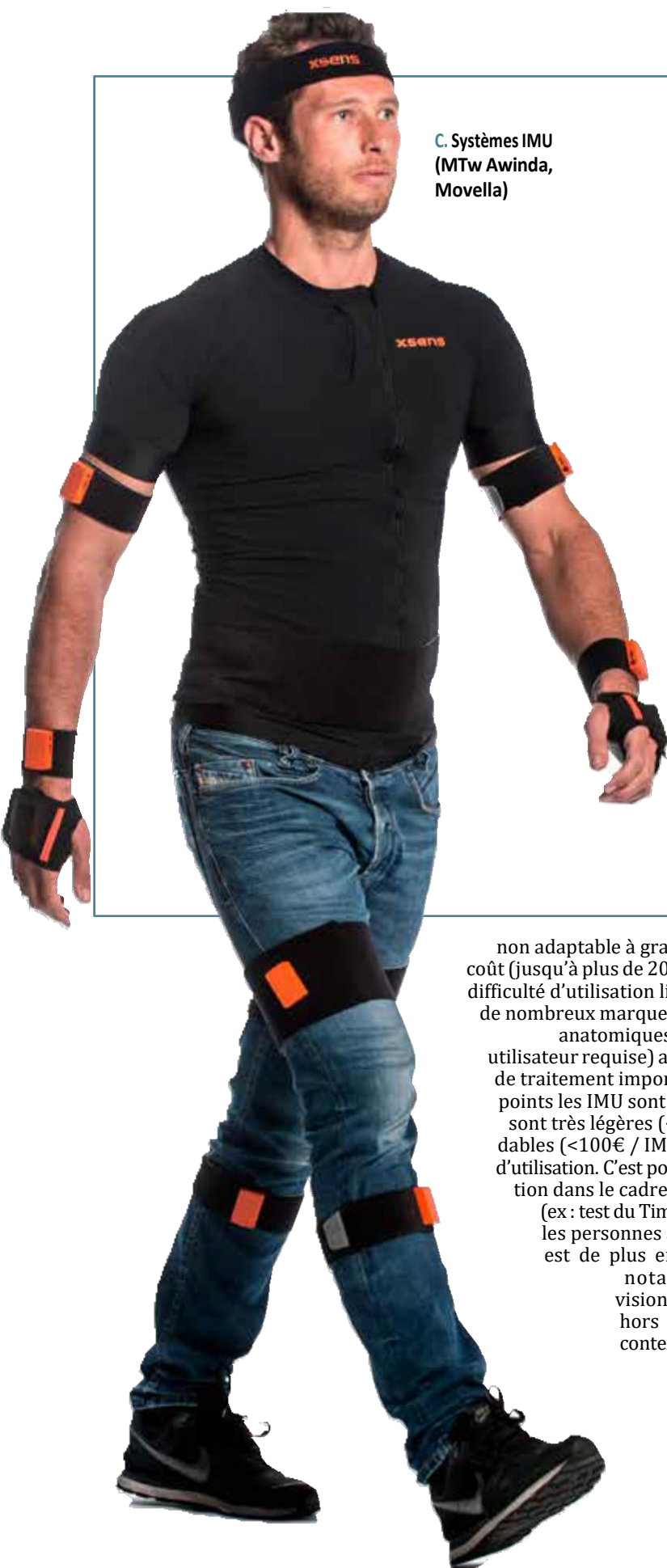
C. Systèmes IMU (MTw Awinda, Movella)